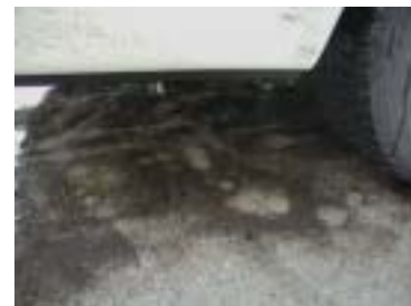
ノージャッキでも効果バツグン

特に、車高が低い車などを洗う場合に、洗車サービスは勿論、整備場やご家庭でもお奨めです。先端がL形に曲がった長いランスを使った場合と比較して、噴射の反力が無く、狙った位置を覗き込んでいる必要も有りません。洗い難い場所がとても簡単に洗え、洗浄水の返り水や、腰が痛くなる、嫌な作業では無くなるでしょう。