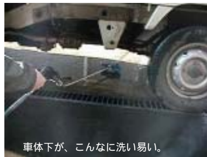
車体下が、こんなに洗い易い。