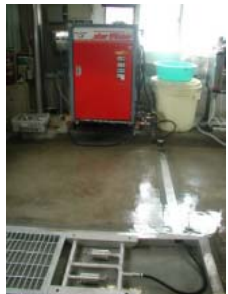
屋内設置例 200mm 幅 カプラ脱着でグレーチングに交換。

お問い合わせ (有)メカトロ信州 〒389-1102 長野県長野市豊野町大倉667-1 TEL 026-257-3115 FAX 026-257-4408